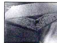
Capcană cu feromon

Viermele și moliile mărului se pot combate și prin metoda captării în masă a masculilor , cu ajutorul capcanelor cu feromoni.