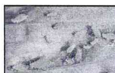
Afide la piersic