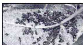
Afide la cireș