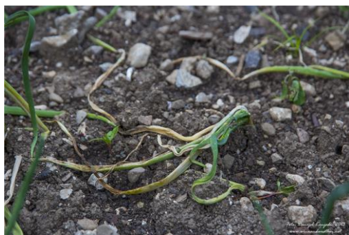
simptome de atac: musca cepei

In cultura de ceapa si usturoi, in special la culturile infiintate din toamna, dar si la culturile infiintate primavara timpuriu, pot fi identificati in aceasta perioada ,urmatorii daunatori: musca cepei ( Delia antiqua ), musca usturoiului ( Suillia lurida ), gargarita cepei ( Ceuthorrhynchus suturalis ), tripsul comun ( Trips tabaci ).