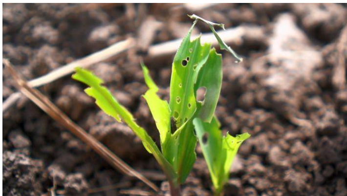
simptome de atac