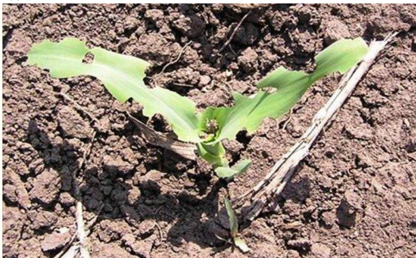
simptome de atac