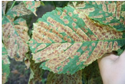
molie miniera la castan

Pentru combaterea acestor daunatori se vor utiliza: