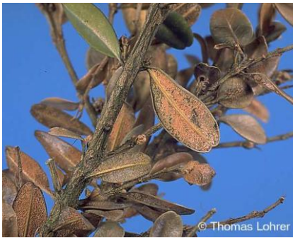
uscarea buxusului ( volultella buxi )