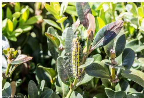
omida paroasa a buxusului ( cydalima perspectalis )