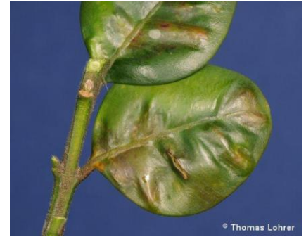
tantarasil frunzelor de buxus ( monarthtropalpus buxi )

PRODUSE RECOMANDATE: TOPSIN M-70-0,07% + NURELLE D 50/500-0,1% sau DIMILIN 48 SC-0,02%