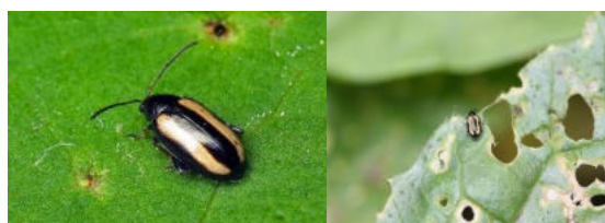
puricele vargat – planta atacata

În culturile de legume crucifere mai apar și alte specii de purici de pământ, cum sunt Phyllotreta undulata și Phyllotreta nigripes , care produc pagube similare.