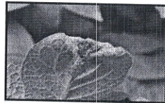
Mană pe frunză