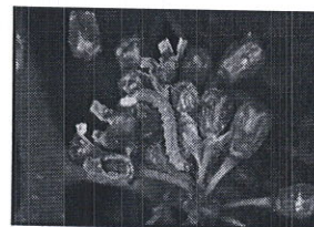
Molia strugurilor - larvă

Perioada optima de tratament: În faza fenologică a culturii “ Înainte de înflorit ”.